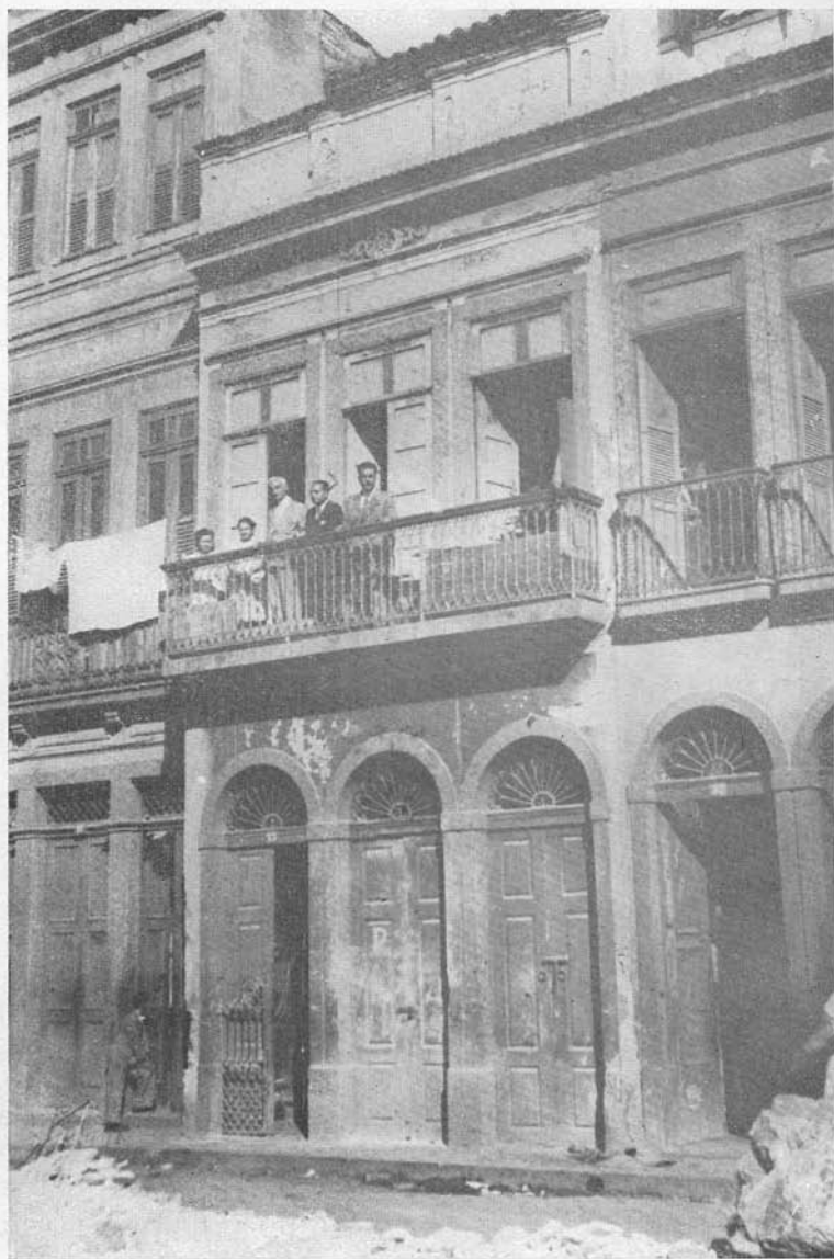
Casa da rua do Cotovelo, onde nasceu Vieira Fazenda, segundo tradição transmitida por contemporâneos do historiador.